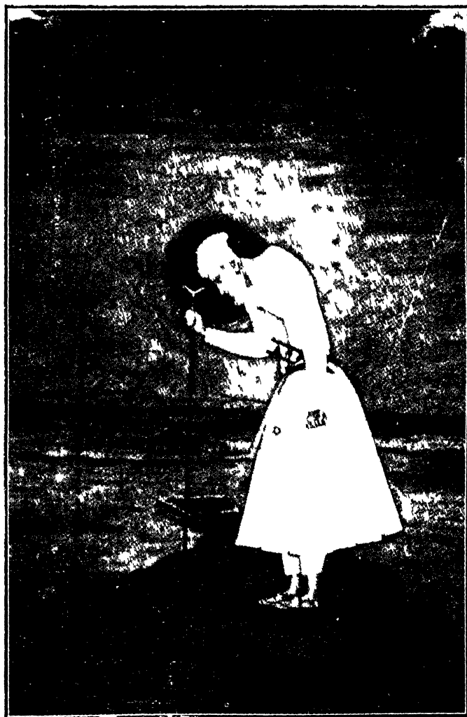
औरंगज़ेब ( वृद्धावस्था )